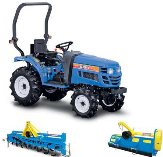
Iseki TM 3267